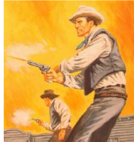
Přestřelka v Stetson City

Tito tvrdí chlapi řešil spory mezi sebou především pomocí svých stejně divokých koltů (odtud také název časopisu) čili pistolí. Z těchto dob také vzniklo také mnoho legend o zázračných pistolnicích, kteří snažili chránit zákon na Divokém západě. Byli to opravdoví hrdinové s ocelovým pohledem, vždy připraveni tasit zbraň. Kovboj strávil na koni až patnáct hodin denně – kůň byl tedy jeho nejoddanější a nejlepší přítel. Nejdůležitějším kusem vybavení bylo také pro kovboje sedlo.