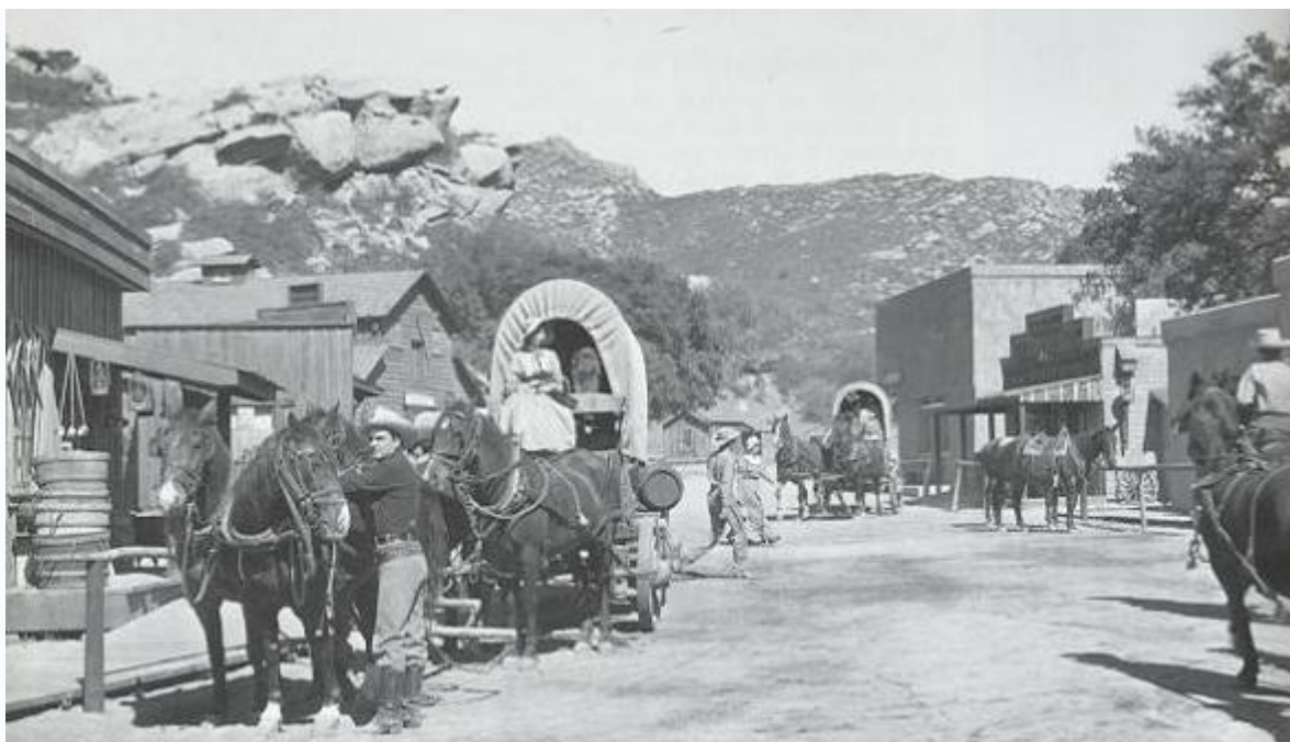
Obrázek – Tak takhle vypadalo Stetson City v roce 1869

V současnosti město žije typickým životem osady, jež vyrostla na železnici a penězích z ní plynoucích. Schází se zde pestrá společnost kovbojů, honáků dobytka, dobytkářů, dobrodruhů i podnikavců. Ti všichni se scházejí ve vyhlášeném podniku nazývaném Trigger-Whiskey-Saloon. Život v Stetson City je hodně divoký. Velmi časté jsou přestřelky, pistolnické souboje. Nejvýznamnější postavou v městečku je Tatiček Kolalok a jeho čtyři synové. Tatiček Kolalok vyrábí nápoj s názvem Whiskola, který se snaží rozvážet po Divokém západě.